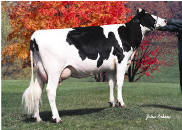
ボ - ガーディング オー マン No . 120