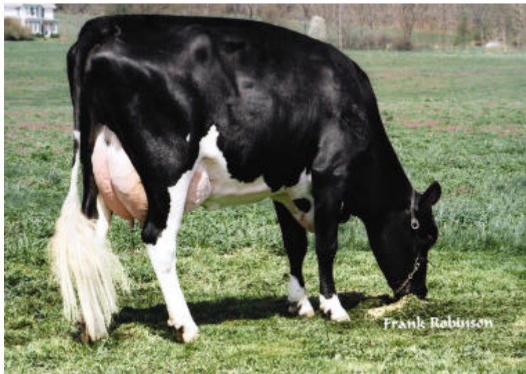
チャールズデール スウィート スター VG - 85