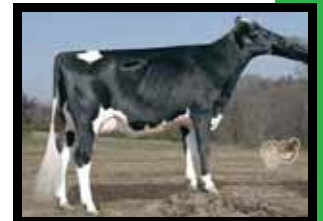
Nelda Design Integrity Joan VG-82