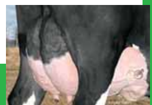
ブリッツハッポッター ポッター チェルシー 314