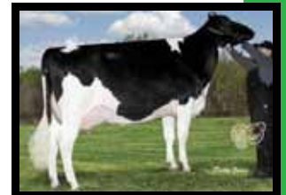
Ringia Promotion Julie VG-85