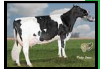
Goldstone Fortune Daisy VG-85 VG-MS