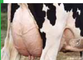
キングスランソフ ポッター 2538

ポッター の娘牛は其々長命性、機能的センスを表し、彼の成績にもそういった特徴が見られます。生産寿命+5.5、娘牛妊娠率+2.0、そして体細胞+2.81という飼養管理に関する形質において素晴らしい数字を伴う ポッター こそ、全ての酪農家を感心させる種雄牛です。また ポッター の分娩難易度は6%であり、未経産への人工授精でも活躍します。