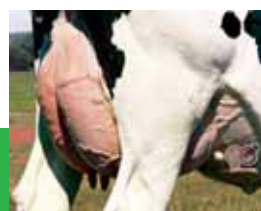
シュミツ ポッター 240