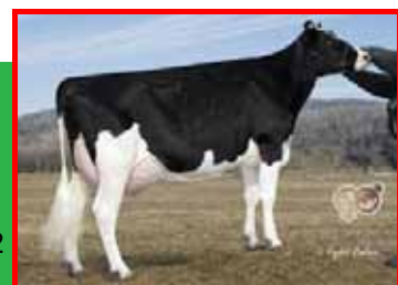
左:ガルシア ニフティ 613 中央:Md メーブル ローソ プロント 2332 右:マホガニー マリオン 487