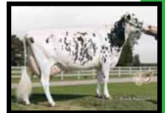
Stroelee Blitz Moby EX-92 EX-MS