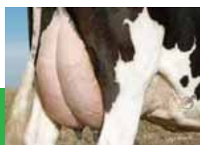
ミラー ポッター 163