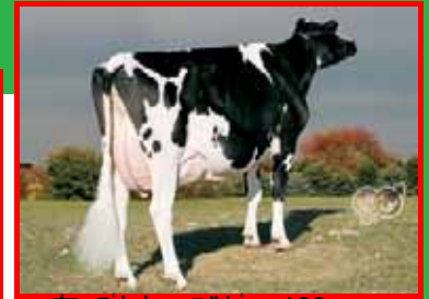
左:フレナー コルビー 186 右:バンドーラ ダミオン サラ