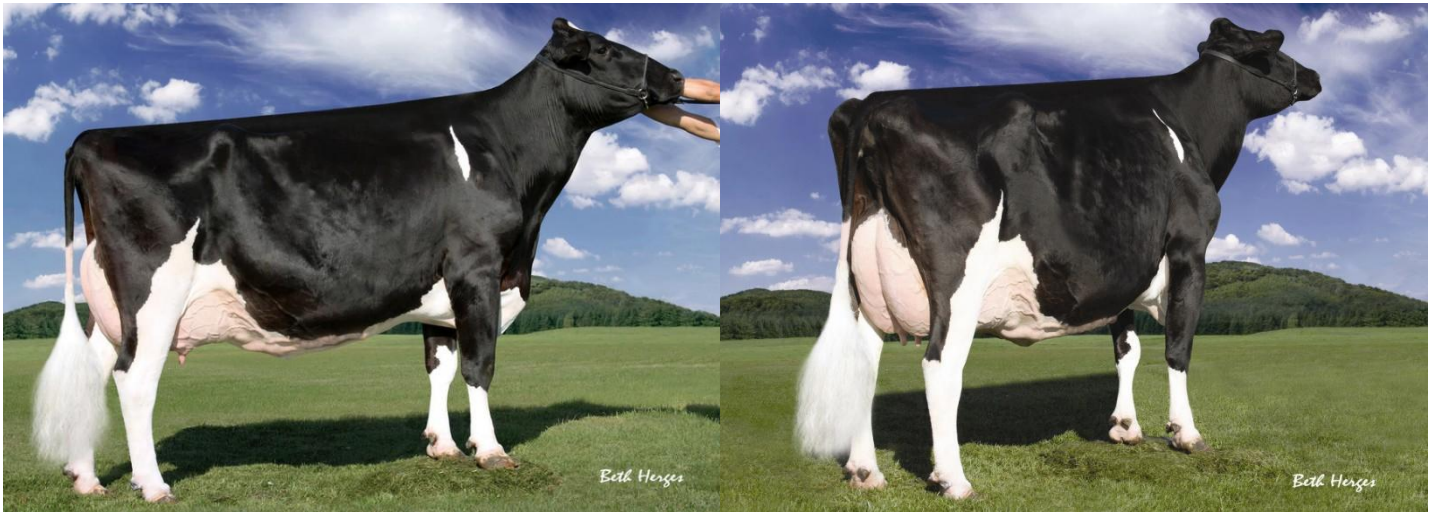
レーガンクレスト PR バービー EX92 本牛

レーガン クレスト PR バービーはしばしばホルスタイン業界で、好体型を作出する最高の血統を持つ牛と呼ばれる。