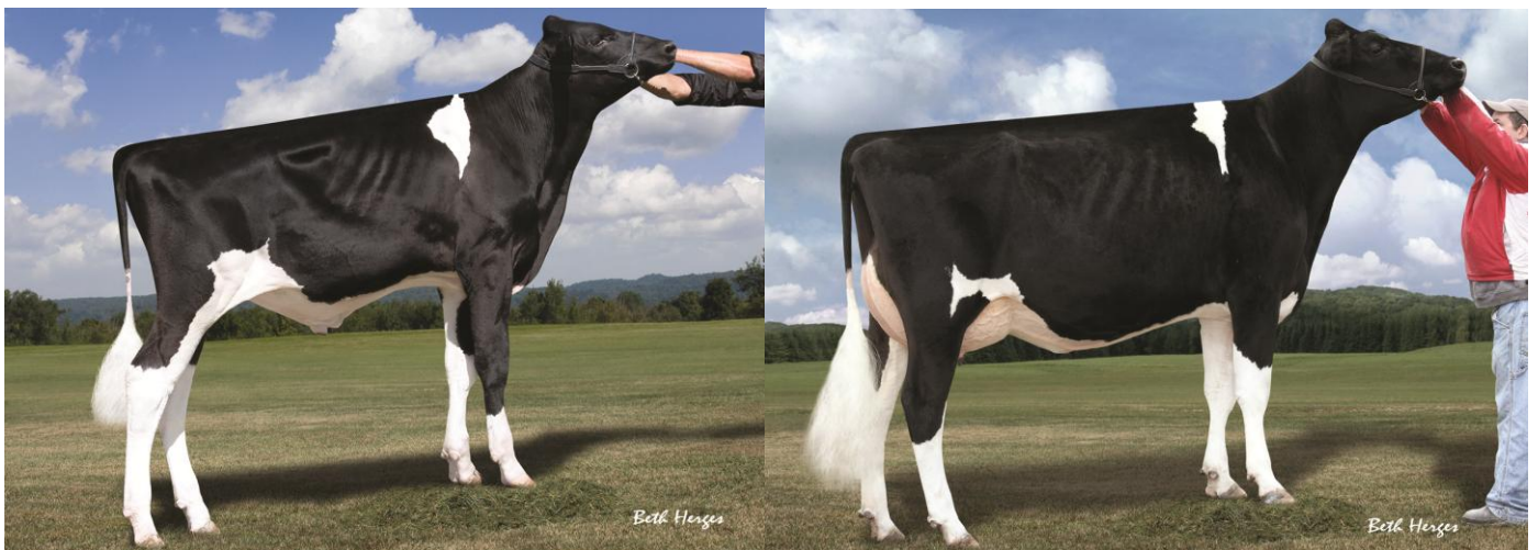
7H11118 ミスター アットウッド ブロカウ

REGANCREST G BEDAZZLE EX91-5YR-USA DOM (父：ゴールドウィン) は最初のバービー娘牛で、CPTAT 第1位になり、シーマース ホルスタインズに販売された。REGANCREST CINDERELLA EX92-2E-USA DOM GMD 4* (父：チャンピオン) は多くの高ジェノミック息牛の母となった。REGANCREST S CHASSITY EX92-4YR-USA DOM (父：ショトル) を含む、多くのトップ娘牛の母である。チャンティーと彼女の14頭の子孫は150万$で販売された。REGANCREST BREYA VG88-3YR-USA DOM 1* (父：ショトル) は以前CPTAT 第1位を獲得した。REGANCREST G BROCADE EX92-4YR-USA DOM (父：ゴールドウィン) も以前のPTAT 第1位であり、子孫と共に$900,000で販売された。REGANCREST BARBARA EX92-4YR-USA DOM GMD (父：ショトル) はCTPI Cow 第31位になり、アイオワ ステイト フェア 2歳級で最初のリザーブインターミディエイトチャンピオンとなった。REGANCREST G BRIZELDA EX90-4YR-USA DOM (父：ゴールドウィン) は4歳4か月305日搾乳で14,864kg、乳脂肪4.0%、乳蛋白3.4%を生産した。REGANCREST MAC BIKASA VG87-2YR-USA (父：マック) は高ジェノミック種雄牛である7H11118 ミスター アットウッド ブロカウの母である。これらとその他のバービー娘牛に続き、リストトップクラスやトップセールスの多くの孫娘がいる。