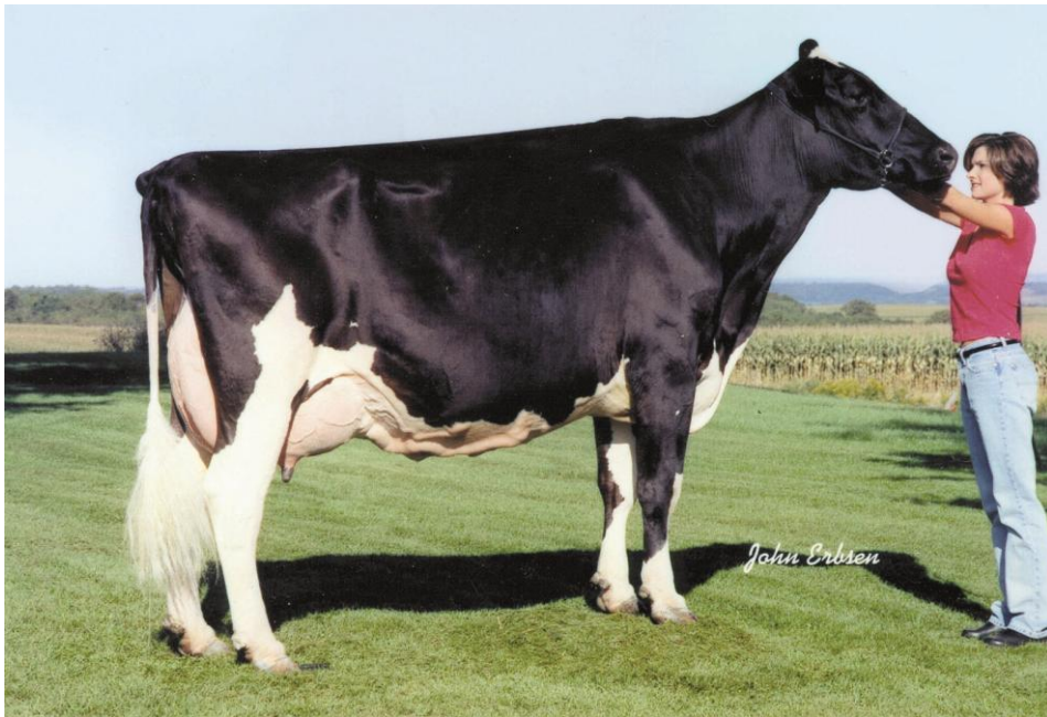
母：レーガンクレスト ジュラー ブライナ EX92

“ウォークウェイ チーフマーク”はバービーの血統で3回現れる。母方3代目の”レーガンクレスト マーク チェアマン ベア EX91-2E-USA GMD DOM”はチーフマークによる娘牛であり、父の母（デリア）はチーフマークの優れた娘牛であり、また母の父（ジュラー）の母もチーフマークの息牛である。チーフマークの多大な影響で、彼女の幅、深さ、前乳房のスムーズな腹壁への移行、ボックスカーの様な尻がどこからきているのか比較的容易に見つけられる。