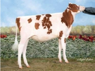
L メーブルス ベズダ カリ レッド 父: 14H5075 ベズダ RC