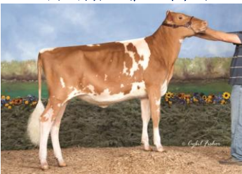
ハーツサイアー ジャックポット スイート 父: 7GU0473 ジャックポット

母: ハーツサイアー リップス スイーティ ET (VG-88) エキジビター: Marshall Overholt, Big Prairie, OH