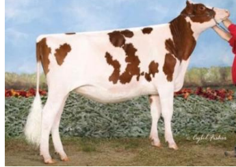
ウィットテール D ベズダ スカイ レッド 父: 14H5075 ベズダ RC