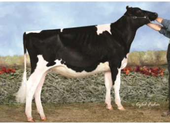
フュージョン パッション ボイズン Sire: 7HQ09264 DEMPSEY

母: フュージョン アロント パッション エキジビター: Ferme JP Petitclerc & Fils, St Basile, QC