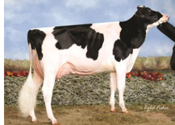
ロケット ジャズミン サンチェス (VG-86) 父: 7H8190 サンチェス

母: ロケット ジョーダンニー ゴールドウイン (EX-90-2E) エキジビター: B. Paquet & S. Rodrigue St-Come-Liniere, Que. Gen-Com Holsteins Ltd Notre-Dame-du-Bon-Conseil, Que