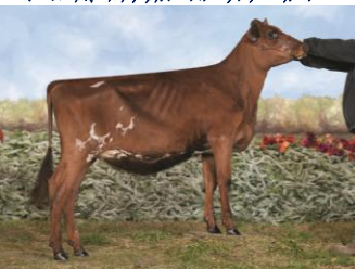
フォーヒルズ パーデット アレックス 3908 父: 7AY0084 パーデット

母: マッシュク マートウズ Bbbk アレックス エキジビター: Britney Hill, Bristol, VT