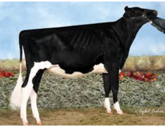
ウエルク シェード サンチェス ケイト 父: 7H8190 サンチェス

母: ウエルク シェード ゴールドウイン ケーラ (VG-87) エキジビター: Elijah Dobay & Kevin Doeberiener Farmdale, OH