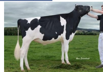
7H10506 GW アットウッド