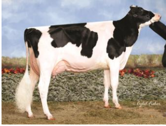
ロケット ジャズミン サンチェス (VG-86-CAN) 父: 7H8190 サンチェス

母: ロケット ジョーダンニー ゴールドウイン (2E-90-CAN) エキジビター: Gen-Com Holstein Ltd, Notre Dame du Bon Conseil, QC