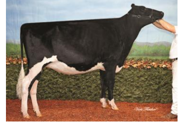
ペティットクラーク アレキサンダー アミーカル 父: 7H8221 アレキサンダー

母: ペティットクラーク ストーム アミー (EX-90-2E) エキジビター: Ferme Jean-Paul Petitclerc & Fils, Inc, St-Basile, Que.