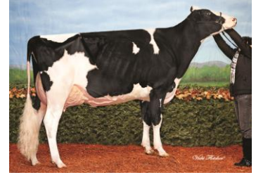
BVK アットウッド アリアナ ET (VG-89-USA) 父: 7H10506 GW アットウッド

母: イストサイド ルイステール アンジェリーナ (EX-90-2E) エキジビター: Quality Holsteins, Vaughan, Ont. Ponderosa Holsteins Cantabria, Spain. AL.BE.RO Land & Cattle Piacenza, Italy