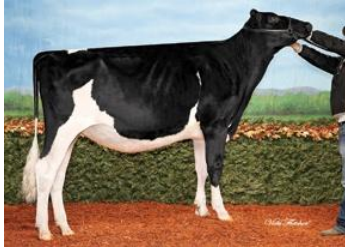
スプリングウエイ サッシー レイ 父: 7H8190 サンチェス