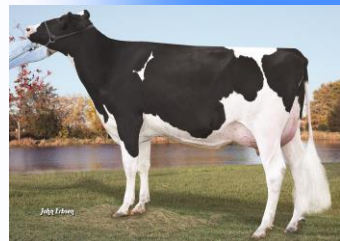
7H10920ゴールドチップ娘牛 SSIGチップオクラ7576ET