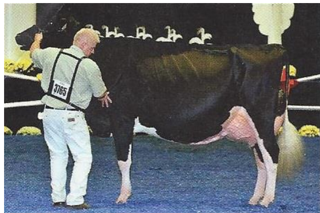
HM グランド チャンピオン： ブラックリーファーム チェリオス チーリオ Milksource Genetics LLC (ウィスコンシン州カウカウ ナ) 所有