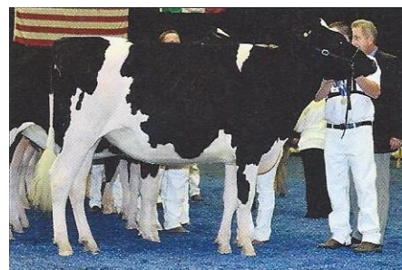
HM ジュニア チャンピオン： M リバービュー ゴールドサン ケリー Eaton, Garrow, Lundy, Liddle&Vail (ニューヨーク州マリエッタ) 所有

オノラブル メンション ジュニア チャンピオン及びウィンター イヤリングのトップは M リバービュー ゴールドサン ケリーだった。「このトップの未経産牛は頭から尻にかけてバランスが取れている。彼女はこの強いトプラインを持ち、胸全体に幅がある。彼女は皆がもっぱらその幅と強さを称賛する未経産だ」と審査員トマスはクラス戦の時に話している。ケリーは Eaton, Garrow, Lundy, Liddle, Phoenix (ニューヨーク州マリエッタ) により所有される。ケリーはニューヨーク スプリング インターナショナル ショウのオノラブル メンション ジュニア チャンピオンでもあり、また、最近開催されたノースイースト フォール ナショナル ショウのクラスでも勝利を収めている。彼女の母系は VG87 のダミオン娘牛、VG85 のエルヒーローズ娘牛へ続く。