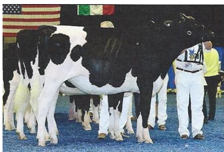
リザーブ ジュニア チャンピオン： ストランズホーム ゴールド アニス Budjon&Vail (ウィスコンシン州ローマ イラ) 所有