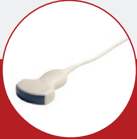
コンベックスプローブ

1 台のエコーで繁殖診断から OPU まで、さまざまな用途に対応し、コスト削減を実現。牛、羊、馬、豚など異なる畜種に対しても使用でき検査の幅が広がります。