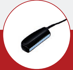
肉質鑑定プローブ