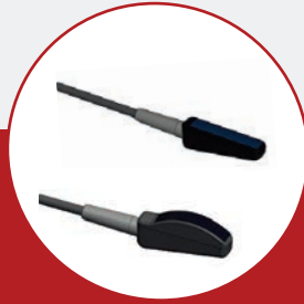
リニア / カーブプローブ